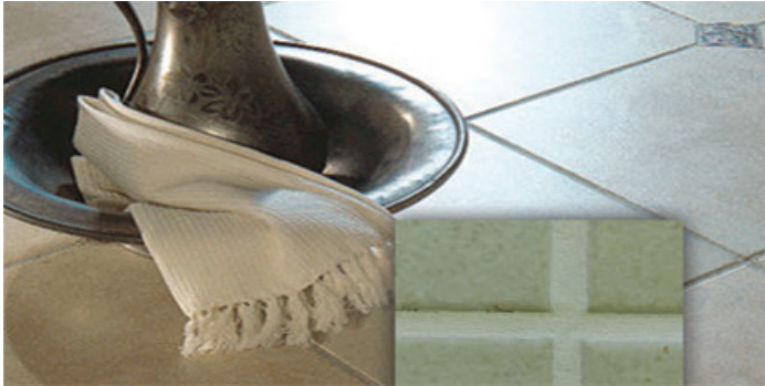
Pastina de acabado fino